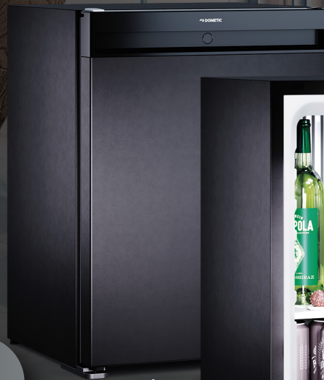
A30S | A40S