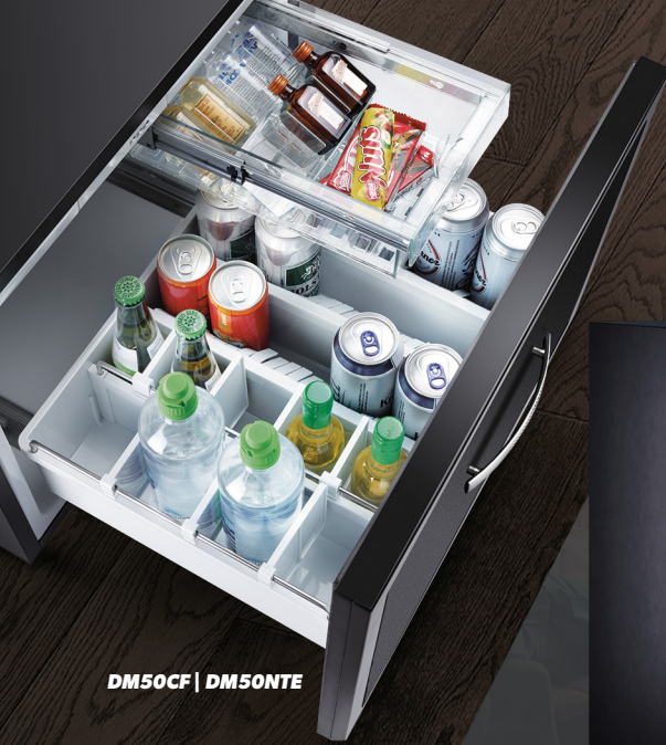
DM50CF | DM50NTE

MINIBAR DE GAVETA | MINIBAR 50 LITROS 30 E 40 LITROS